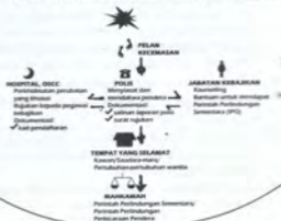
GAMBAR RAJAH 2: Carta Aliran Pilihan untuk Mangsa-Survivor