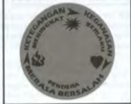
GAMBAR RAJAH 1: Kitaran Keganasan

Jika anda terus sanggup didera semata-mata demi kepentingan anak-anak, fikirkanlah ini: Kebanyakan anak-anak akan lebih menderita sekiranya mereka terus tinggal dalam persekitaran ganas berbanding dengan keluarga di mana ibu bapa berpisah. Penyelidikan menunjukkan bahawa anak-anak yang datang dari keluarga yang mengalami situasi penderaan mungkin akan membesar sebagai pendera atau menerima keganasan sebagai sesuatu yang biasa.