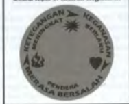
GAMBAR RAJAH 1: Kitaran Keganasan

Jika anda terus sanggup didera semata-mata demi kepentingan anak-anak, fikirkanlah ini: Kebanyakan anak-anak akan lebih menderita sekiranya mereka terus tinggal dalam persekitaran ganas berbanding dengan keluarga di mana ibu bapa berpisah. Penyelidikan menunjukkan bahawa anak-anak yang datang dari keluarga yang mengalami situasi penderaan mungkin akan membesar sebagai pendera atau menerima keganasan sebagai sesuatu yang biasa.